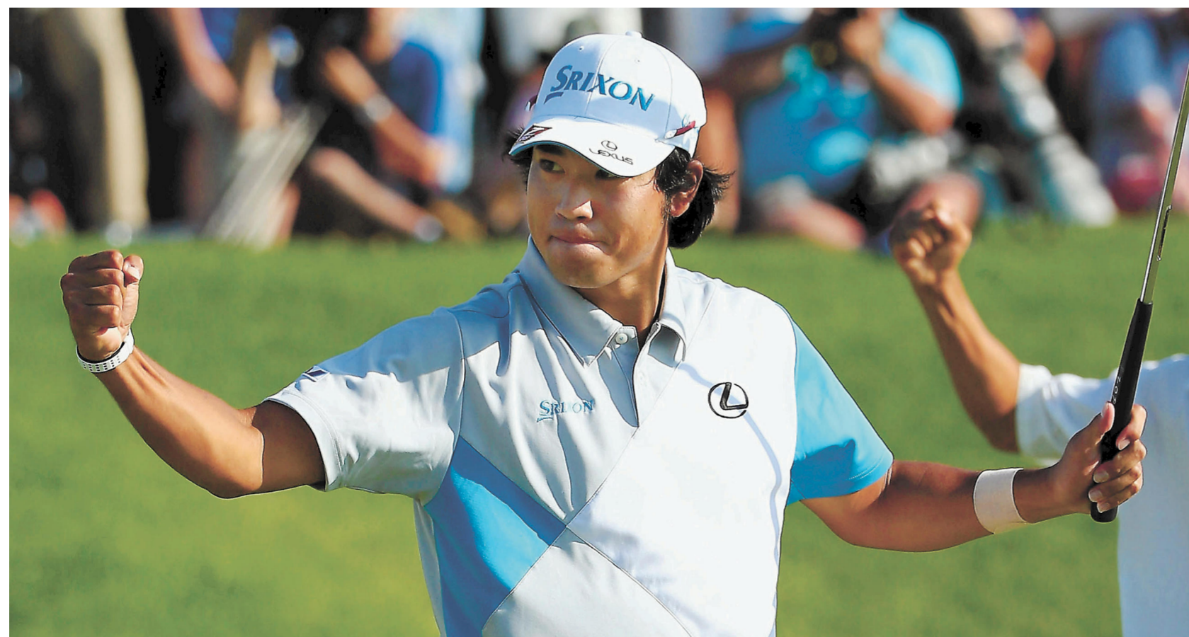
2014年のメモリアル・トーナメント、米ツアー初優勝を決め、ガッツポーズする