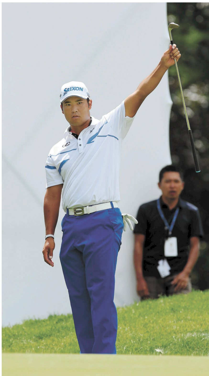
2017年のプリチストン招待、逆転で米ツアー5勝目を挙げる