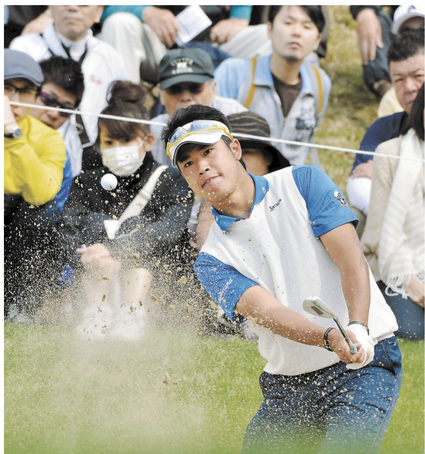
2013年のつるやオープン、ツアー最短記録のプロ転向2戦目で優勝した