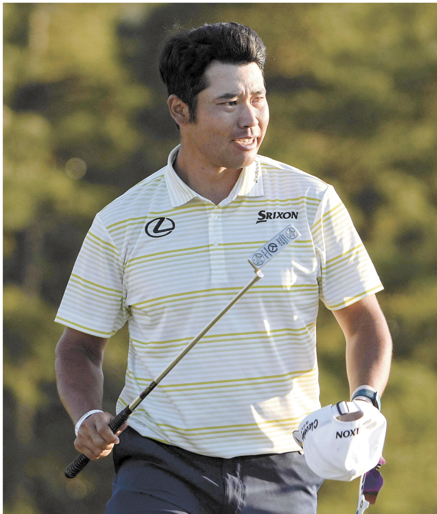
米ゴルフのマスターズ・トーナメントで、日本男子初のメジャー制覇を果たした松山＝11日、米ジョージア州のオーガスタ・ナショナルGC